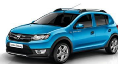
Bleu Azurite COD RPL