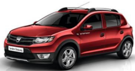
Rouge de Feu COD B76