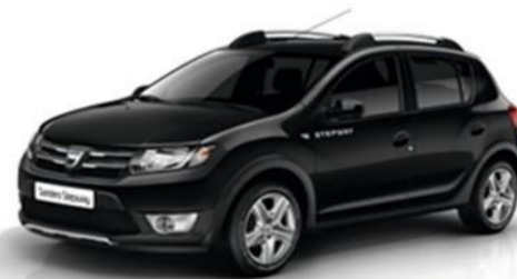
Noir Nacré COD 676