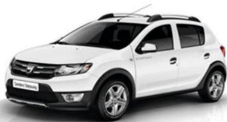
Gris Platine COD D69